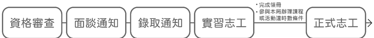
圖 1 招募流程圖